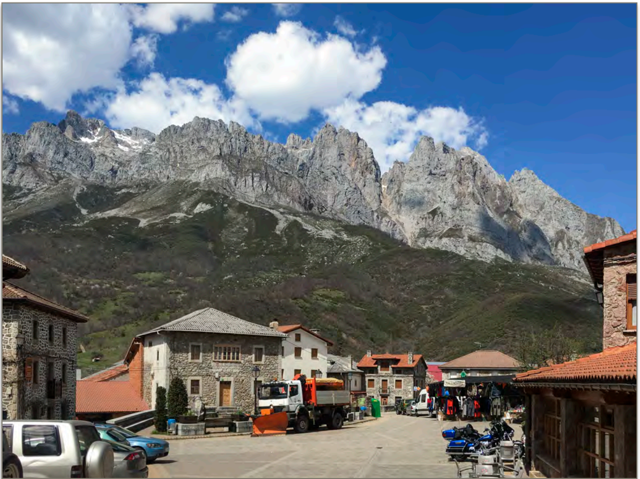
Posada de Valdeón en el corazón de los Picos de Europa, una de las paradas de esta edición de nuestro Touring.