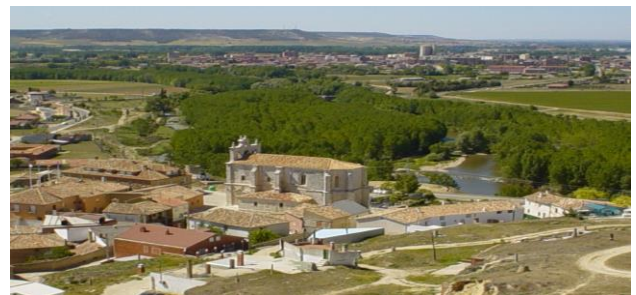
Valle del Cerrato

La ruta continuará dirección norte, dejaremos atrás el Valle del Esgueva y nos adentraremos en el Valle del Cerrato , vecino palentino y por sus carreteras comarcales descubriremos otro tipo de paisajes y rincones de la meseta castellana. En esta parte del recorrido haremos una breve parada en Cevico de la Torre para repostar quienes lo precisen y hasta aquí, habremos recorrido unos 120 km.