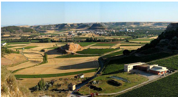
Valle del Cuco

Saldremos del Hotel La Vega y en unos kilómetros ya nos incorporaremos a la emblemática " Ruta de los Castillos " en su inicio por Valle del Esgueva entre los cauces del río Duero y su afluente el Pisuerga. Rodaremos por bonitos pueblos castellanos de la cara sur del valle y de entre la infinidad de viñedos de la Ribera del Duero descubriremos las distinguidas y selectas bodegas con D.O.