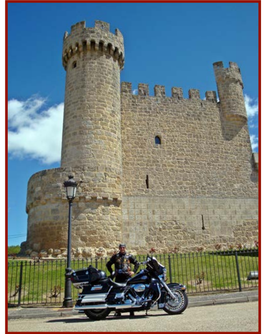
Las llanuras de Castilla y sus inconfundibles paisajes son los protagonistas de la ruta de este touring.

Ampliamos la temporada de verano del CANTABRIA H.O.G. CHAPTER con un nuevo Touring, el TIERRAS DE BURGOS, con una ruta que nos va a llevar por las provincias de Cantabria, Palencia y Burgos.